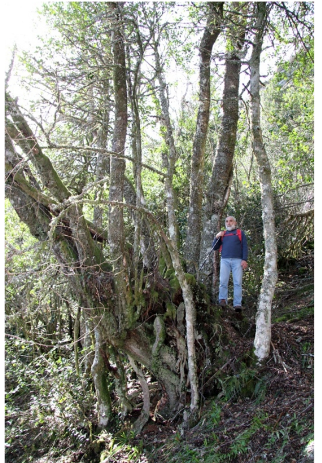
Bidueiro na parte alta da devesa (6,6 m de perímetro)