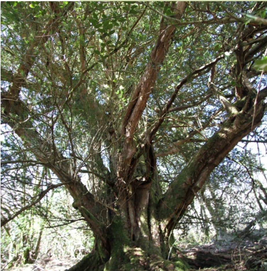
Teixo dos "Sete Homes", (4,6 m de perímetro). Situado na parte alta da devesa.