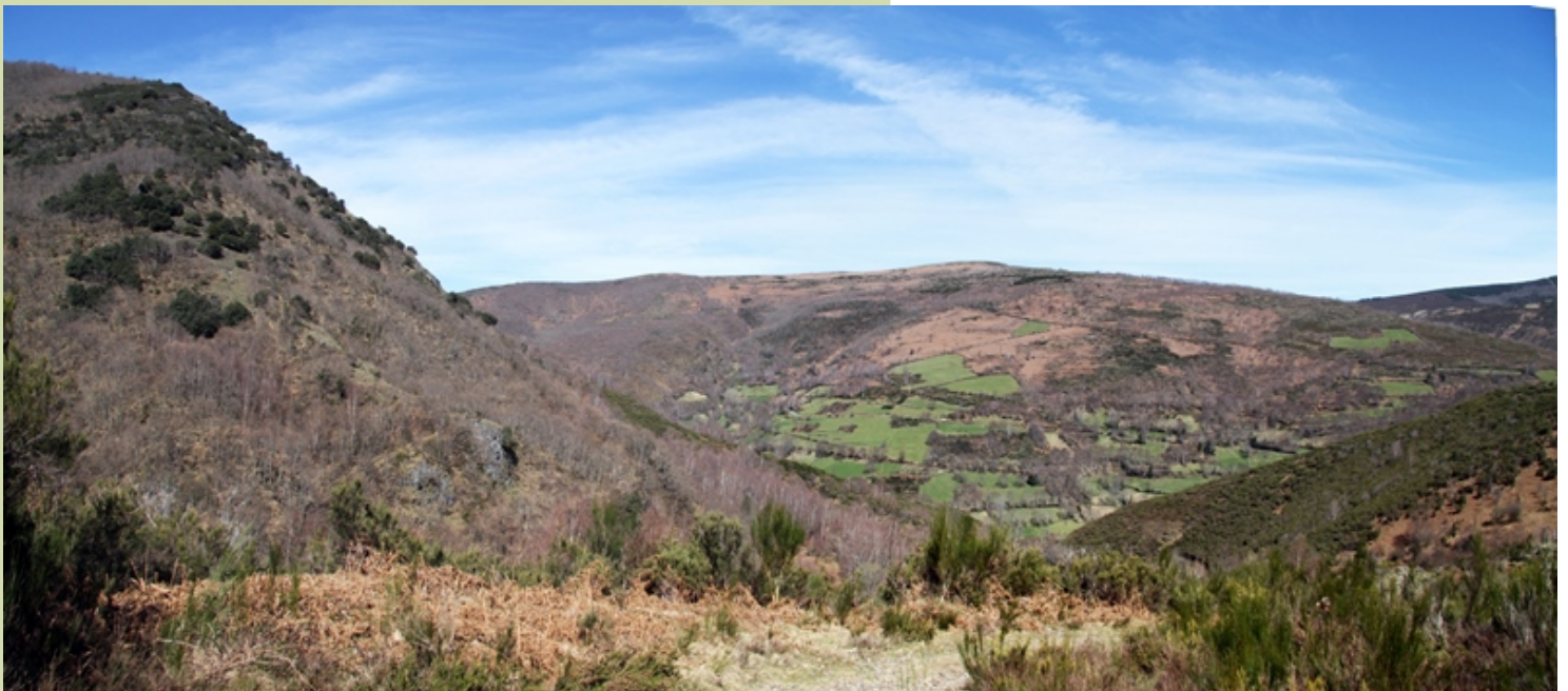
Vista desde a parte media da ruta: á esquerda aciñeiras sobre rochas calcáreas.