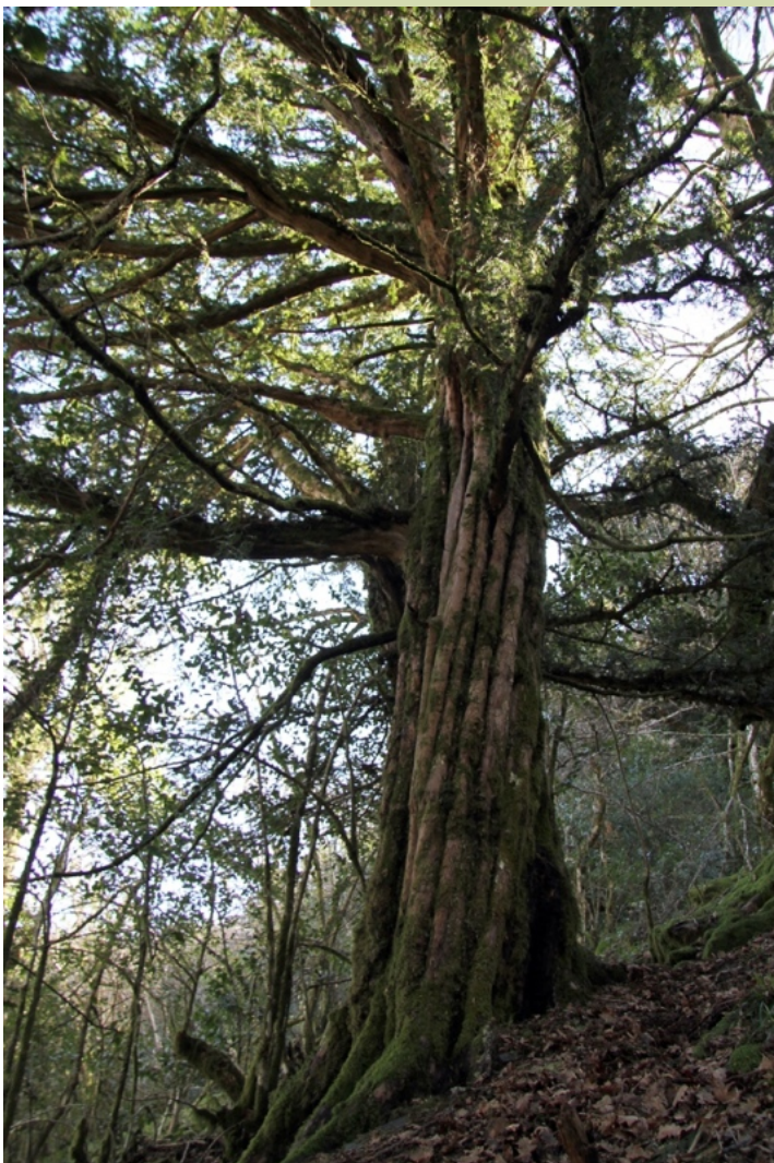
Teixo (3,2 m de perímetro)