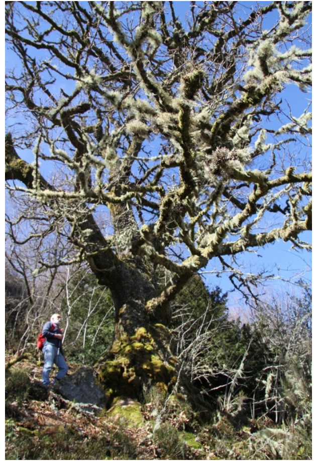
Carballo na parte alta da devesa (5,3 m de perímetro)