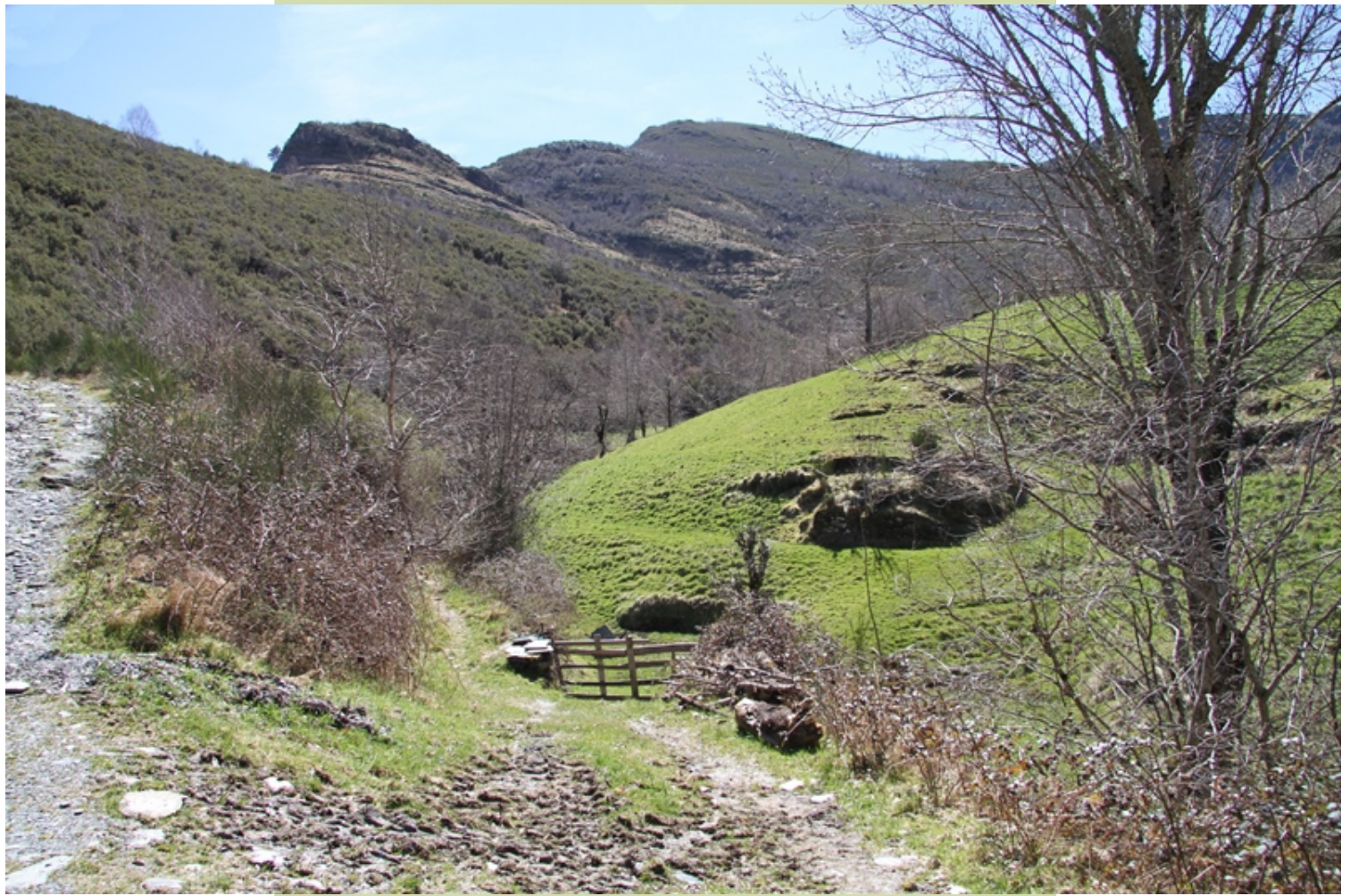
No comezo da ruta