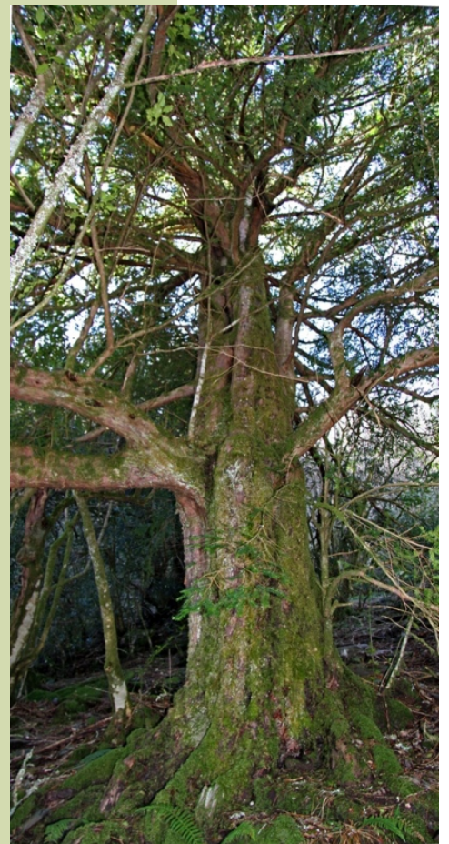
Teixo (3,2 m de perímetro)