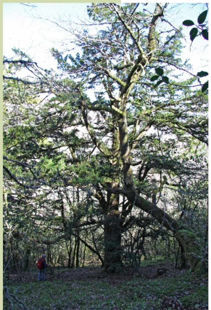
Un dos escasos espazos abertos no interior do bosque.