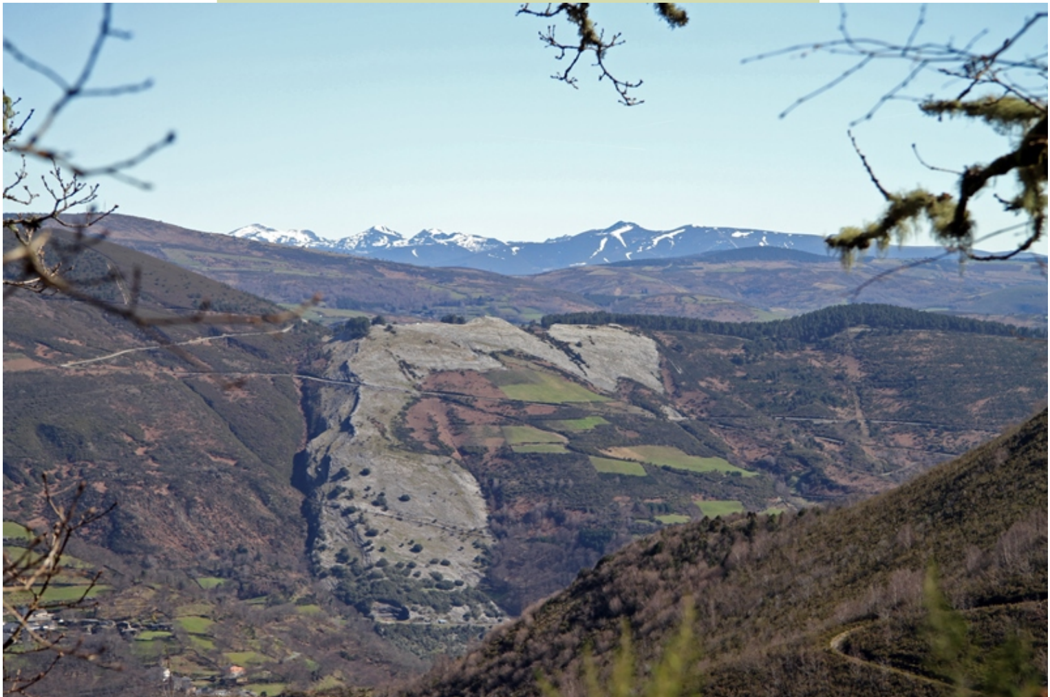
Panorámica desde a parte alta da ruta. O Taro Branco e ao fondo Os Ancares.