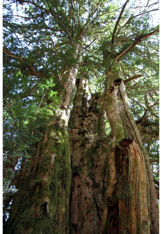
Teixo dos "Sete Homes"

A Devesa da Escrita ou de Paderne está situada nas abas que dan cara ao norte da penas da Escrita, unha prolongación da serra de Lúzara. É un bosque mixto de carballos, teixos, acivros, capudres... e nas proximidades das zonas húmidas bidueiros, salgueiros... cunha rica diversidade de plantas de sotobosque e fauna. Na zona de rochas calcáreas hai aciñeiras e no contorno do bosque mato de uces.