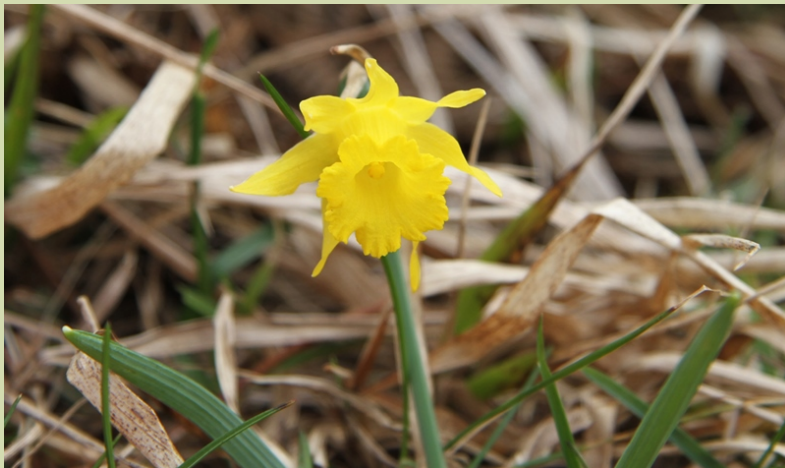
Narcissus asturiensis , unha especie catalogada como vulnerable.