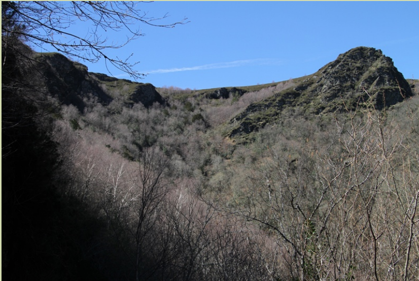
Vista da parte alta da devesa. As manchas escuras son os teixos.

Na ruta empréganse unhas catro horas, non pola distancia senon porque o terreo ten moito desnivel, e convén facela mentras as árbores non teñen follas e ademais, mentras se fai a aproximación, convén facer unha composición do espazo, sinalando no papel a posición dos elementos destacados, para ter unha referencia aproximada porque ao ir subindo as árbores, aínda sen follas, dificultan moito a visión do bosque e no interior non hai sinalización algunha.